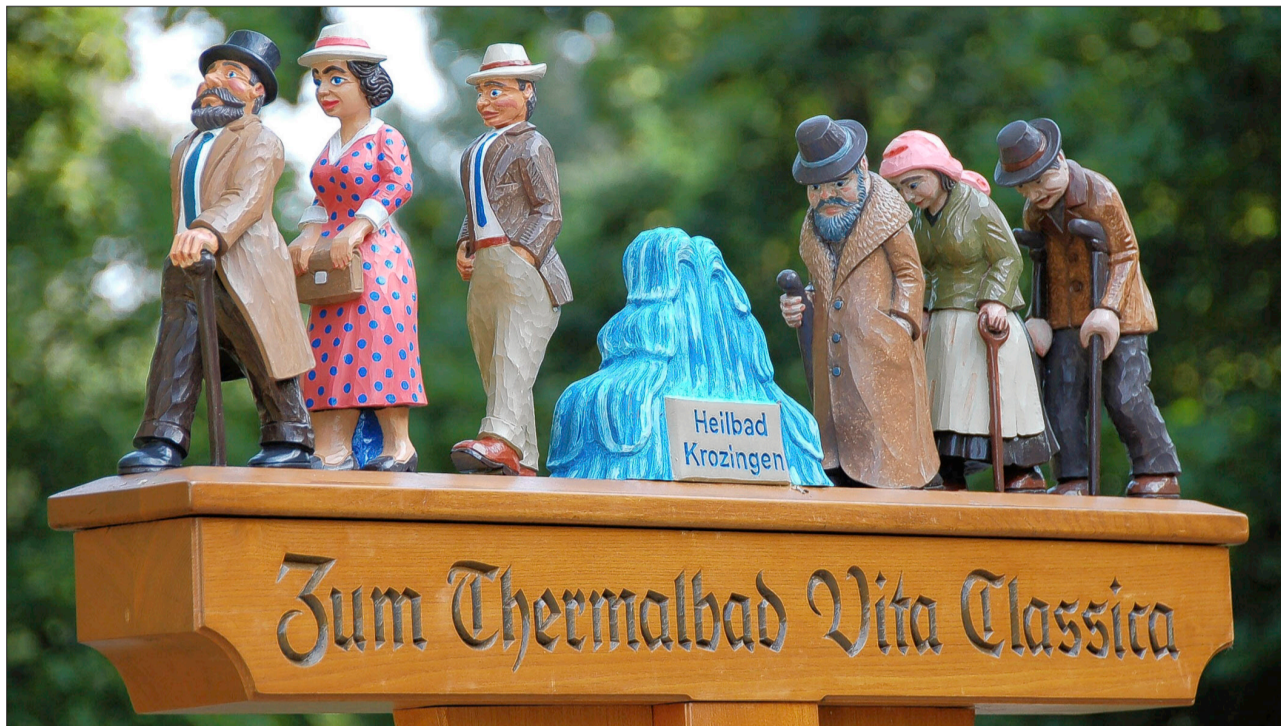
Nach Jahren des Rückgangs haben Heilbäder wieder mehr Zulauf.

In den vergangenen Jahren sah es deutlich schlechter aus: „1996 war unser Einbruch, der eng mit den Auswirkungen der Gesundheitsreform zusammenhing.“ Einige Häuser blieben auf der Strecke, wie jüngst eine Klinik in Bad Schussenried. 1996 gab es 250 Vorsorge- und Reha-Einrichtungen im Land, 2005 waren es 221. Gleichzeitig kamen weniger Patienten und sie blieben kürzer. Das müssen die 57 Heilbäder und Kurorte im Land ausgleichen. Doch dem Heilbäderverband zufolge braucht es mindestens sieben Privatzahler, um einen von der Kasse genehmigten Kuraufenthalt wettzumachen. Dieser